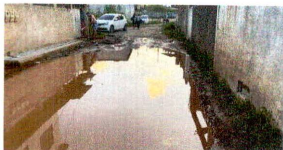
Único acesso a Escola "Maurício Martins"

É assim que se encontra. Sem condição de podermos levar nossos filhos com mobilidade reduzida à escola.